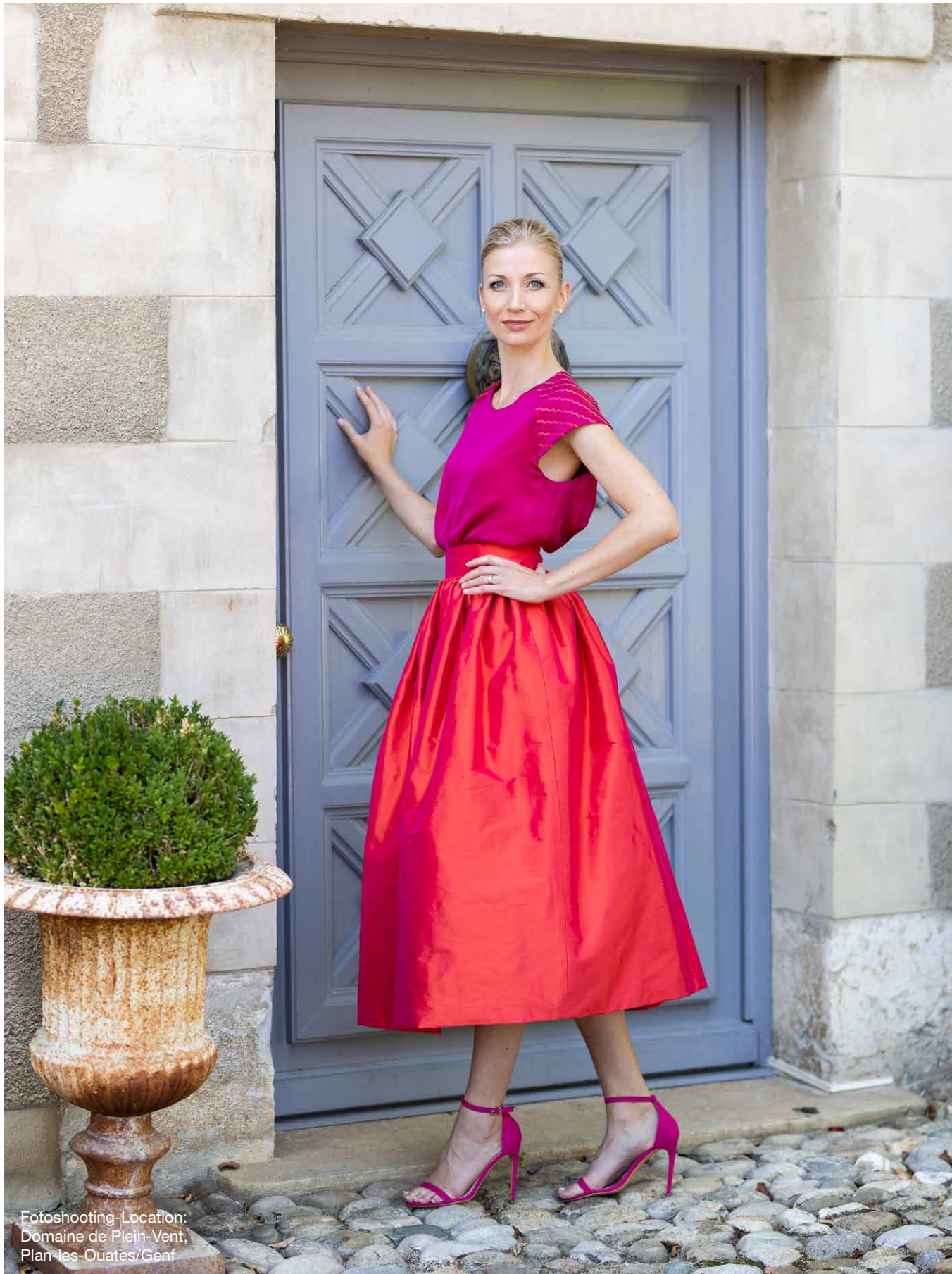
Fotoshooting-Location: Domaine de Plein-Vent, Plan-les-Ouates/Genf