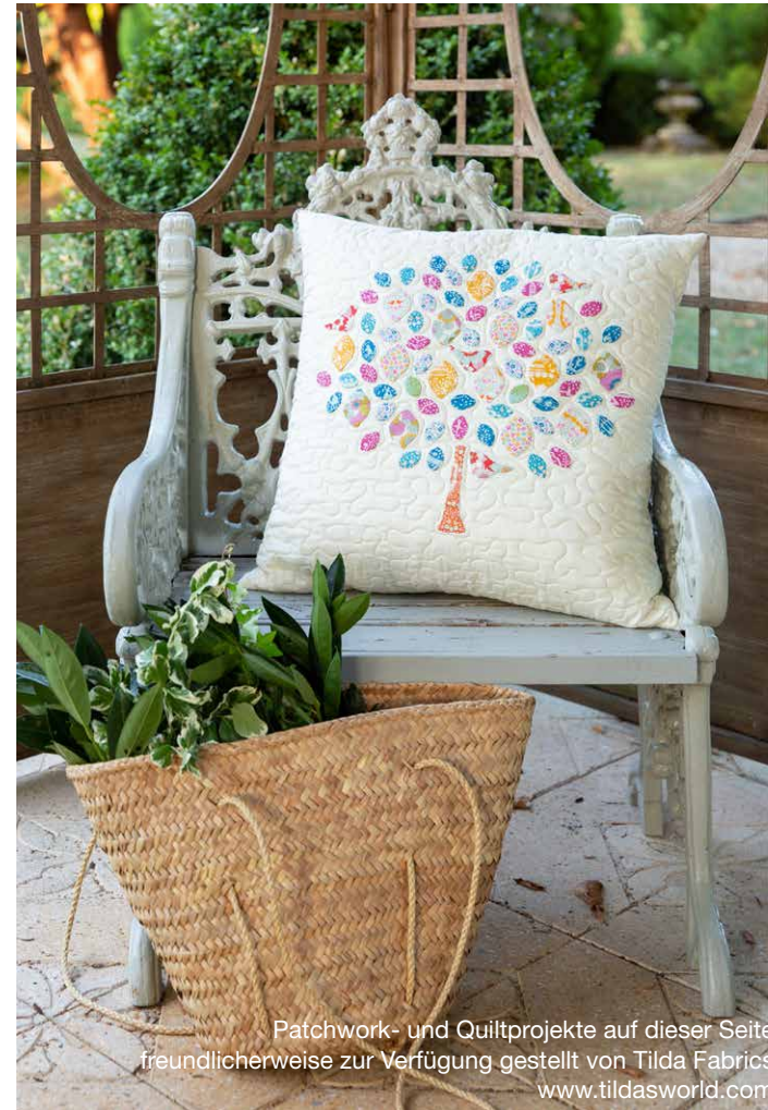
Patchwork- und Quiltprojekte auf dieser Seite freundlicherweise zur Verfügung gestellt von Tilda Fabrics www.tildasworld.com